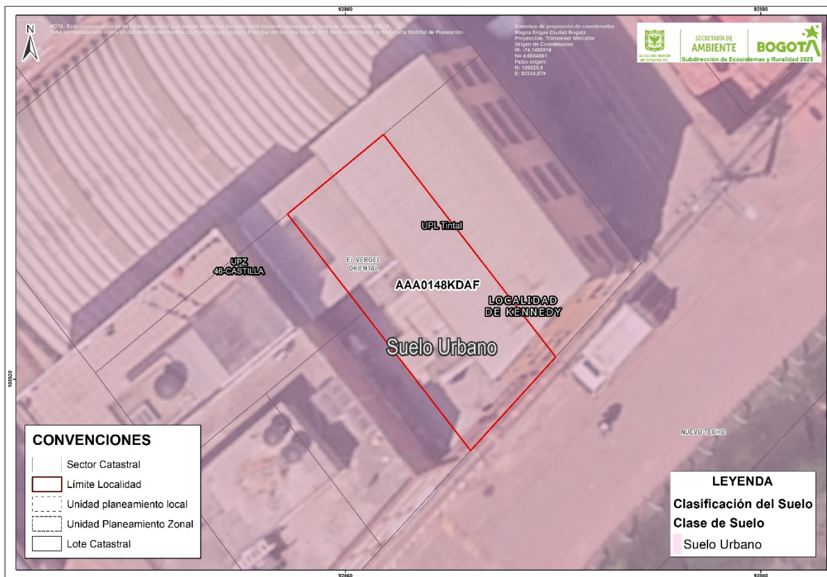
Imagen 1. Localización del predio identificado con CHIP Catastral AAA0148KDAF en suelo urbano del Distrito Capital.

(*) Información a partir de lo establecido en los artículos 9 y 10, y el parágrafo 2 del artículo 490 del Decreto Distrital 555 de 2021.