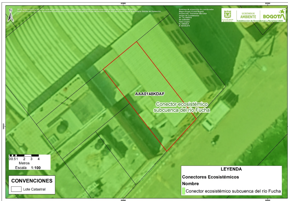
Imagen 4. Localización del predio identificado con Chip Catastral AAA0148KELF respecto a los conectores ecosistémicos.

Nota: Las imágenes e información presentadas anteriormente son de referencia cartográfica, en caso de ser requerido, deberán ser verificadas topográficamente en el predio por el interesado y se deberán respetar los límites de los elementos de la Estructura Ecológica Principal - EEP.