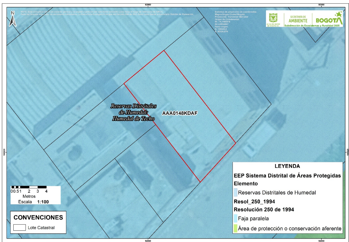
Imagen 2. Localización del predio identificado con CHIP Catastral AAA0148KDAF respecto de la Estructura Ecológica Principal.